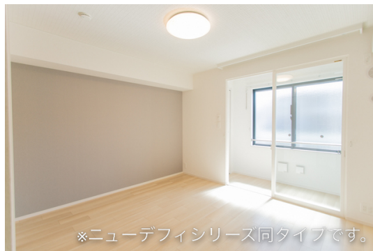
※ニューデフィシリーズ同タイプです。