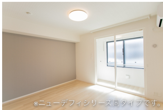
※ニューデフィシリーズ同タイプです。