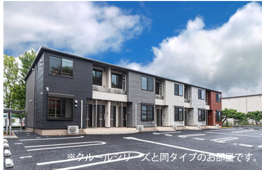
※カーペットと同タイプのお部屋です。