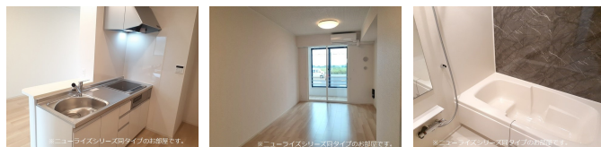
間取りの「S」はサービスルーム(納戸)です。