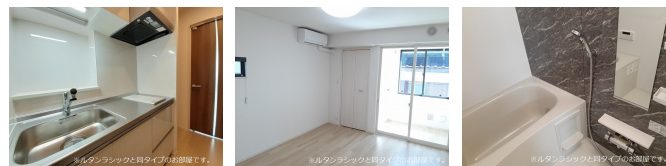
間取りの「S」はサービスルーム(納戸)です。