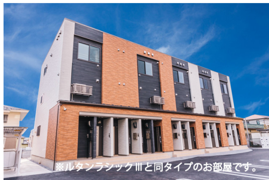
※ルタンラシックⅢと同タイプのお部屋です。