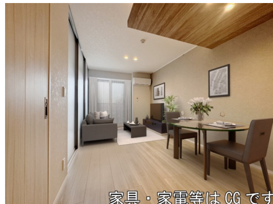
家具・家電等はCGです