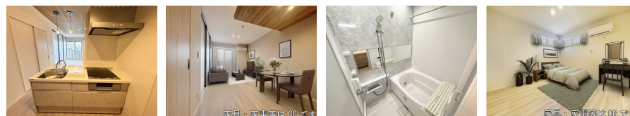
家具・家電等はCGです