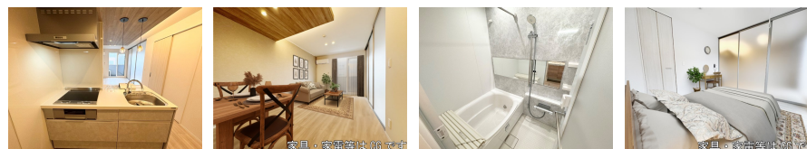
家具・家電等はCGです