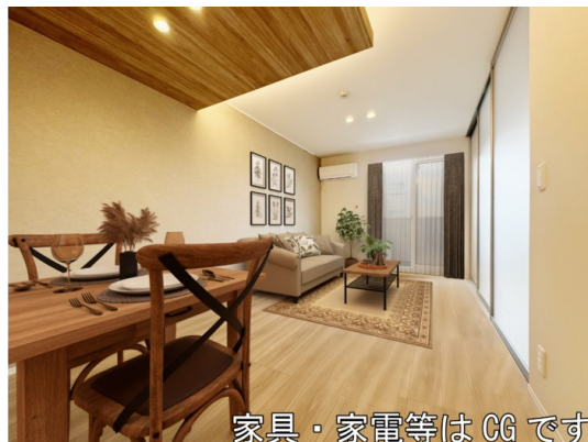
家具・家電等はCGです