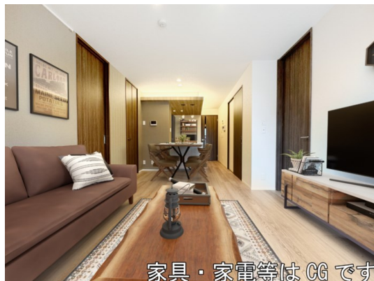
家具・家電等はCGです