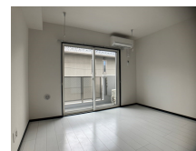
間取りの「S」はサービスルーム(納戸)です。