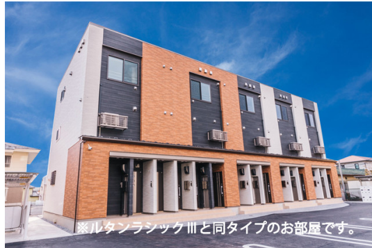
※ルタンラシックⅢと同タイプのお部屋です。