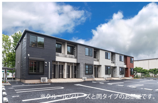
※クルールルズと同タイプのお部屋です。