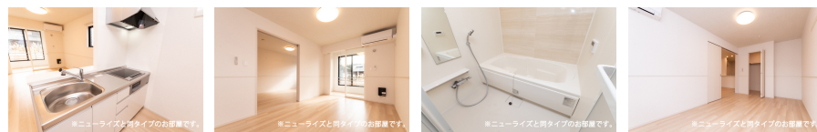
※ニューライズと同タイプのお部屋です。