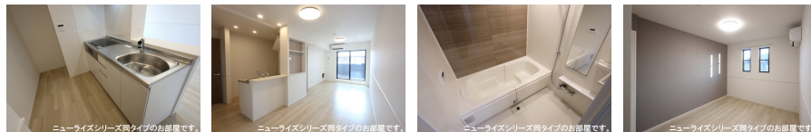
ニューライズシリーズ同タイプのお部屋です。