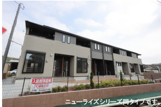
ニューライズシリーズ同タイプです。