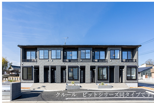
クールビットシリーズ同タイプです。