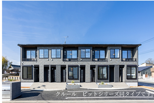
クールビットシリーズ同タイプです。