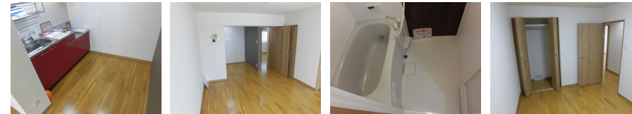
間取りの「S」はサービスルーム(納戸)です。