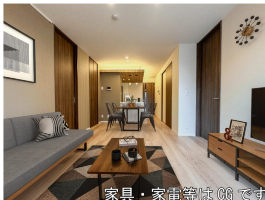
家具・家電等はCGです