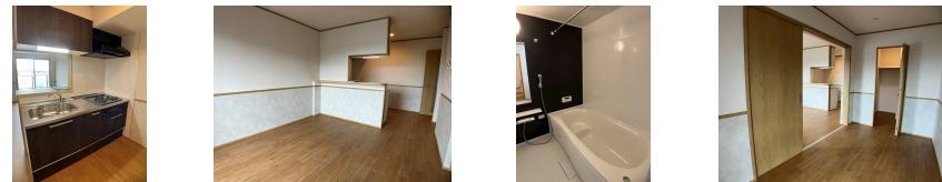
間取りの「S」はサービスルーム(納戸)です。