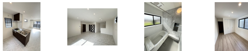
間取りの「S」はサービスルーム(納戸)です。