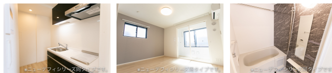
図面と現況が異なる場合は現況が優先となります。