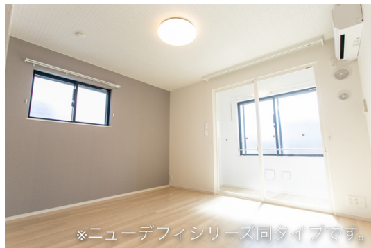
※ニューデフィシリーズ同タイプです。