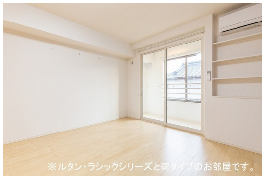
※ルタン・ラシックシリーズと同タイプのお部屋です。