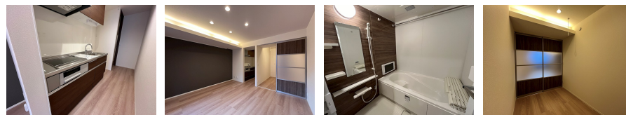
間取りの「S」はサービスルーム(納戸)です。