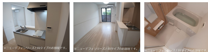
*ニューフィニッシュと既タイプのお部屋です。 (New finish and existing type rooms.)