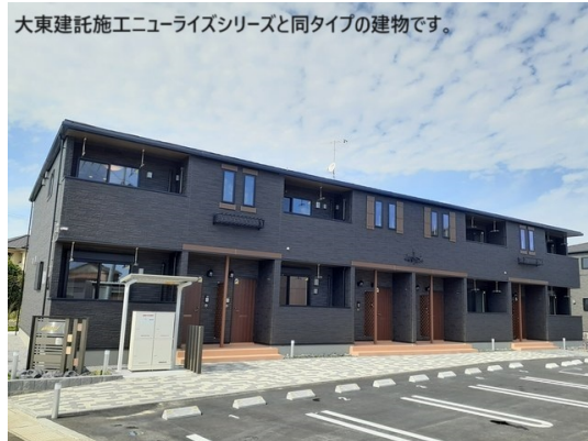
大東建託施工ニューライズシリーズと同タイプの建物です。