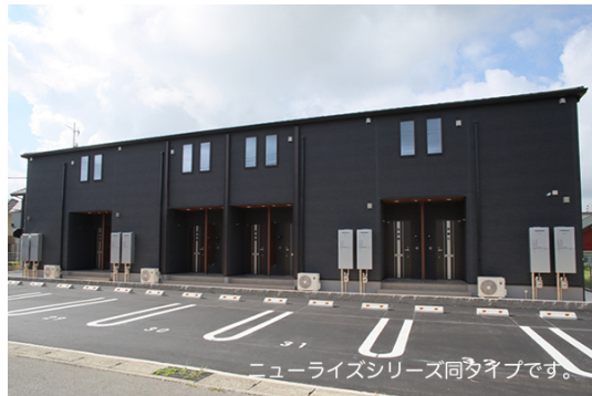
ニューライズシリーズ同タイプです。