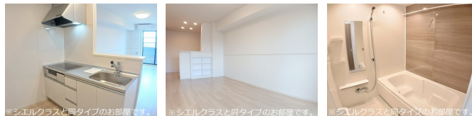
※シエルクラスと同タイプのお部屋です。