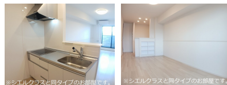
※シエルクラスと同タイプのお部屋です。