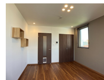
間取りの「S」はサービスルーム(納戸)です。