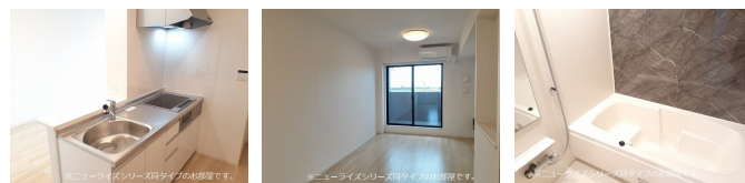
間取りの「S」はサービスルーム(納戸)です。