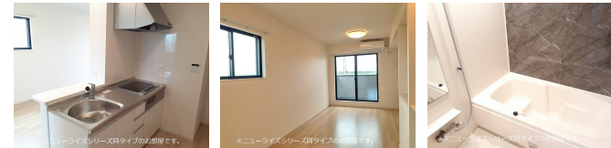
間取りの「S」はサービスルーム(納戸)です。