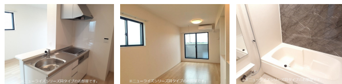
間取りの「S」はサービスルーム(納戸)です。