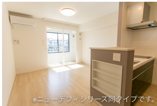
※ニューデフィシリーズ同タイプです。