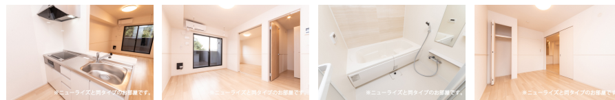
※ニューライズと同タイプのお部屋です。