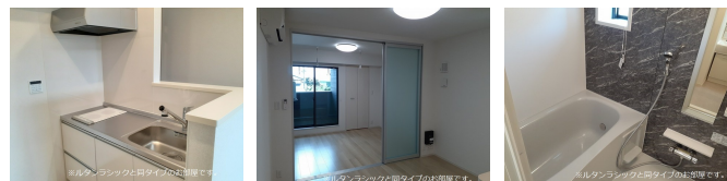
間取りの「S」はサービスルーム(納戸)です。