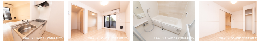
※ニューライズと同タイプのお部屋です。