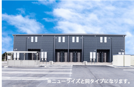
※ニューライズと同タイプになります。