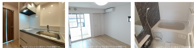
間取りの「S」はサービスルーム(納戸)です。