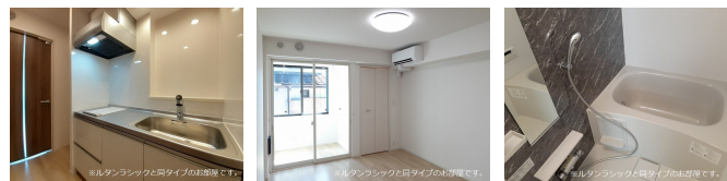
間取りの「S」はサービスルーム(納戸)です。