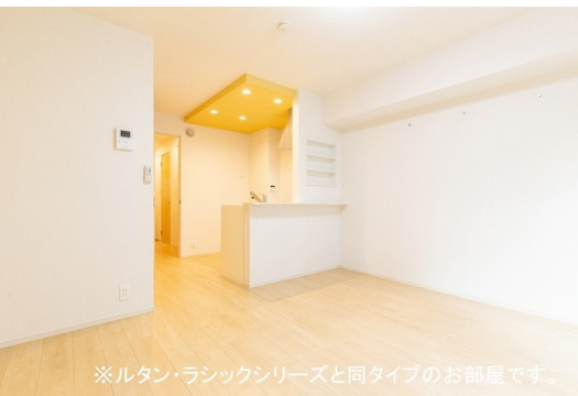
※ルタン・ラシックシリーズと同タイプのお部屋です。