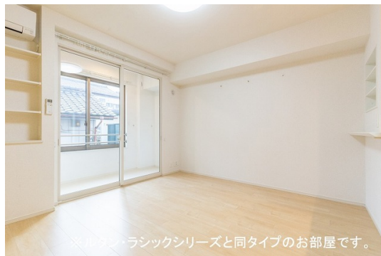
※リクルスラシックシリーズと同タイプのお部屋です。