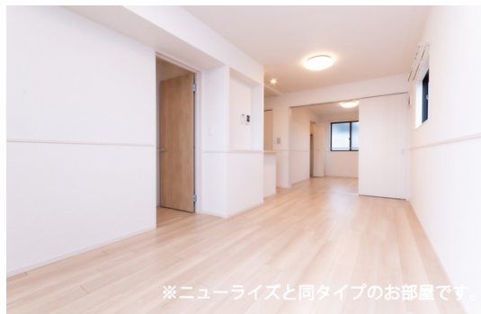
※ニューライズと同タイプのお部屋です。