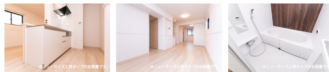
※ニューライズと同タイプのお部屋です。