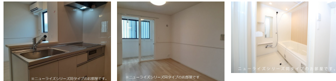
図面と現況が異なる場合は現況が優先となります。