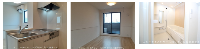
間取りの「S」はサービスルーム(納戸)です。