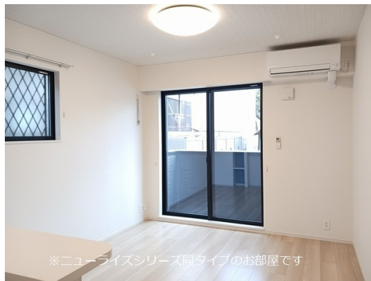
※ニューライズシリーズ同タイプのお部屋です