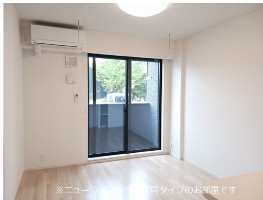
※ニューラッシュは同タイプのお部屋です