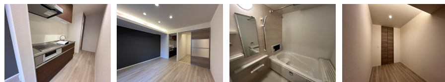
間取りの「S」はサービスルーム(納戸)です。