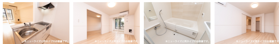
※ニューライズと同タイプのお部屋です。